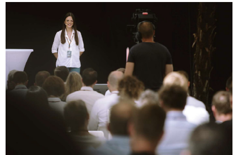
Wie die Generation Z tickt und welche Bedürfnisse sie hat, verriet Influencerin und „Marketing-Nerd“ Alina Ludwig.